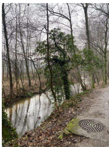
Etape Ressource, pollution, cycles de l'eau